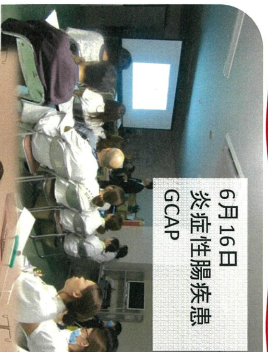
6月16日 炎症性腸疾患 GCAP

5Fでびんがヒコウまきて いるのが分かりました。 また実際には実践してみる ことができてよかった。 よかった。