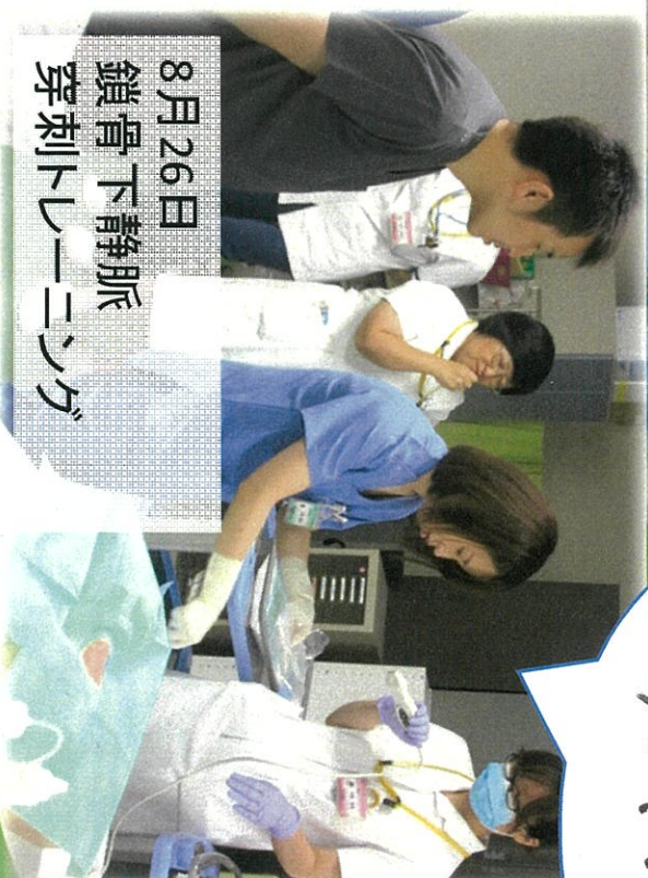
8月26日 鎖骨下静脈 穿刺トレーニング

エコーを使、70CVCカテーテル 挿入の目的は分かる、たまたま だが、たのび、手順が わかりました。