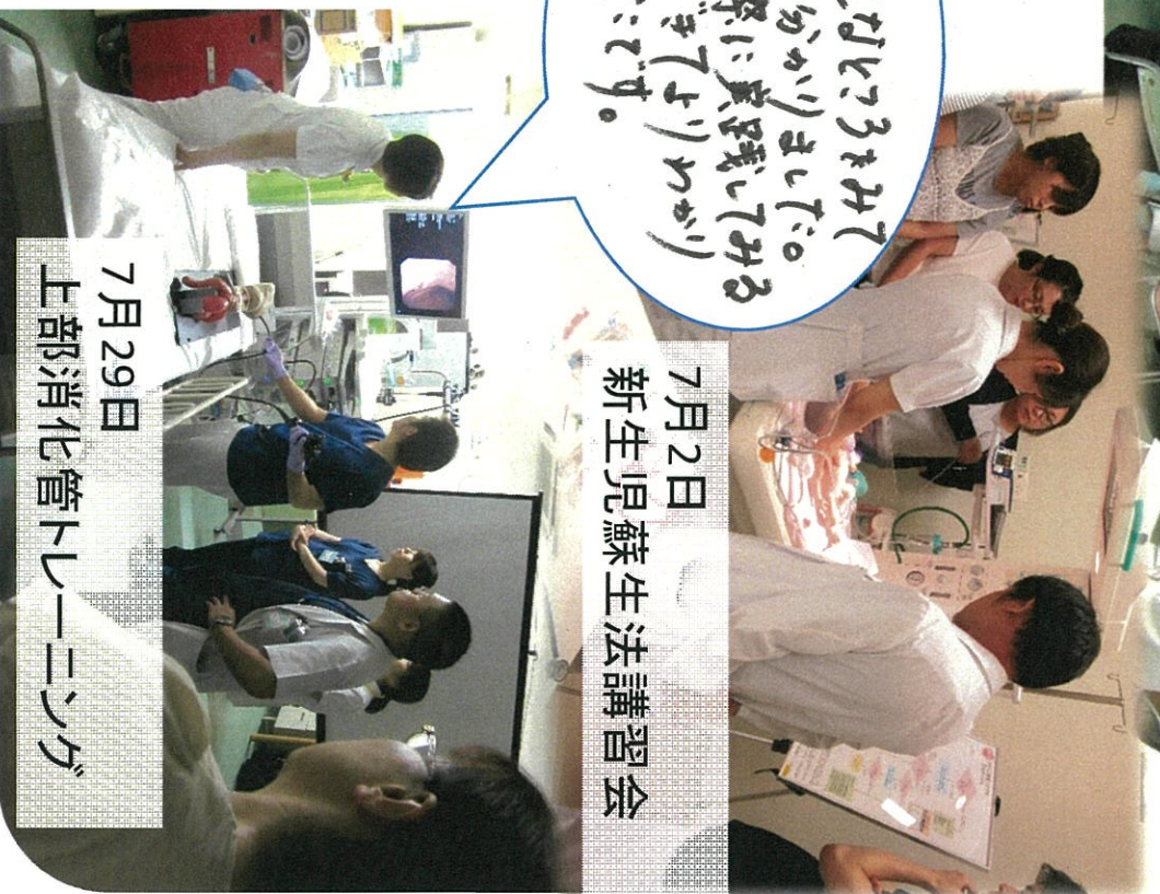
7月2日 新生児蘇生法講習会

5Fでびんがヒコウまきて いるのが分かりました。 また実際には実践してみる ことができてよかった。 よかった。