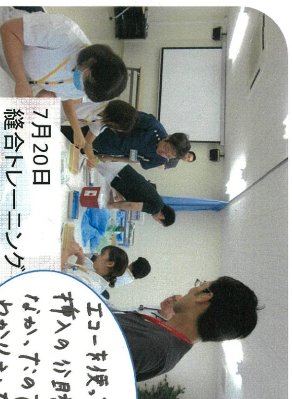
7月20日 縫合トレーニング

エコーを使、70CVCカテーテル 挿入の目的は分かる、たまたま だが、たのび、手順が わかりました。